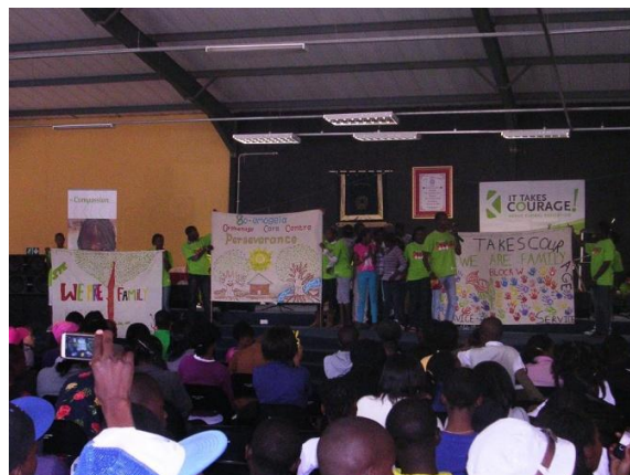
Waisenkinder von Lesedi-Potlana haben einige Plakate für diese grosse Tagung gemacht. Die riesige Teilnehmerzahl hat alle überrascht.

Es gibt lustige, wunderschöne und „verrückte“ Frisuren bei den kleinen und grossen Kindern. An einem Spass-Nachmittag wurden die unter grossem Gelächter die verrücktesten Frisuren gemacht. Es ist schön, im Alltag dieser geprüften Kinder so viel Freude und Spass zu erleben. Hier einige Varianten von „Crazy Hairstyle“: