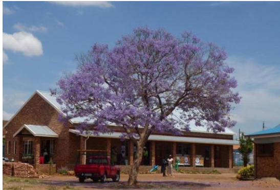
Um das Haus wird es mit dem Einsetzen des Sommerregens wieder etwas grün und schon bald suchen die Kinder Schutz vor der heissen Sommersonne.

Nach einem langen und kalten Winter hat sich der Frühling mit der wunderschönen Blütenpracht der Jakaranda Bäume durchgesetzt. Pretoria ist bekannt dafür, dass die ganze Stadt in violett gefärbt ist. Auch in Soshanguve bei unserem Zentrum Lesedi-Potlana blühte der Baum wunderschön. Farben im und ums Haus erfreut Kinder, Betreuer und Besucher.