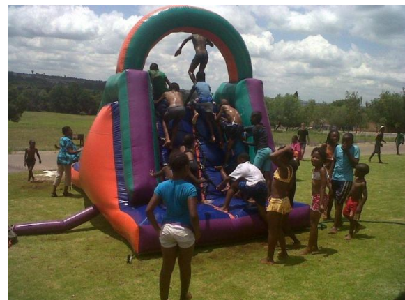
Die Fun-Party mit der Jugendgruppe von „Liewende Word“ war für die Waisenkinder ein einmaliges, unvergessliches Erlebnis

Die Tagesabläufe haben sich in den Zentren gut eingespielt und beinhalten ein ausgewogenes Programm. So wird Zeit eingeplant für das Lernen in Altersgruppen, die Erledigung der Hausaufgaben, gemeinsam Themen diskutieren, die individuelle Betreuung und für Spass und Spiel eingeplant.