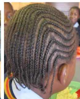
Einige hatten Schwerarbeit zu leisten, um die Frisur nach dem lustigen Nachmittag wieder in Ordnung zu bringen.

Mit herzlichem Dank für Ihre Unterstützung