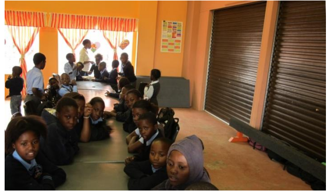
Im Haus wurden Vorhänge abgestimmt auf die Wandfarben angebracht. Eine Trennwand im Gebäude bringt für die Nutzung grosse Vorteile.

Dieses Jahr werden in allen drei Zentren individuelle Aktivitäten für das Jahresende geplant. Die Waisenkinder vom Block W wurden von einer Kirchgemeinschaft zu einem „Party Tag“ in Pretoria eingeladen. Schön ist, dass dank Ihren Spenden im Dezember wieder an alle Kinder, resp. Pflegemütter grosszügige Lebensmittelpakete zu Weihnachten verteilt werden können.